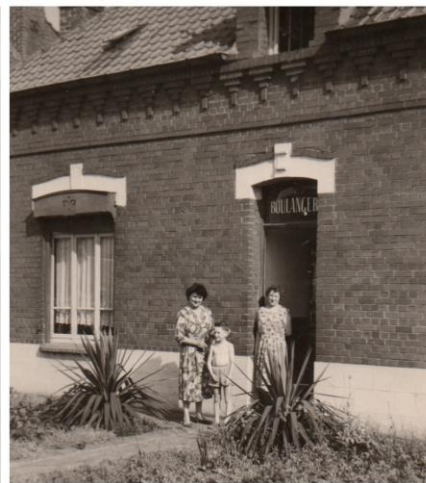
Façade de la Boulangerie au 10 rue Pasteur