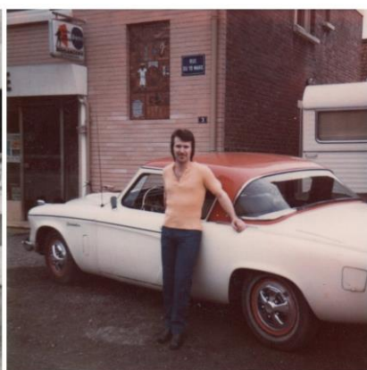
déjà la passion des voiture anciennes