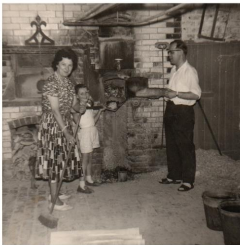
Le Four à bois