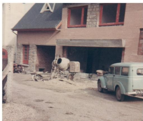
Les prémices de la boulangerie (1967)